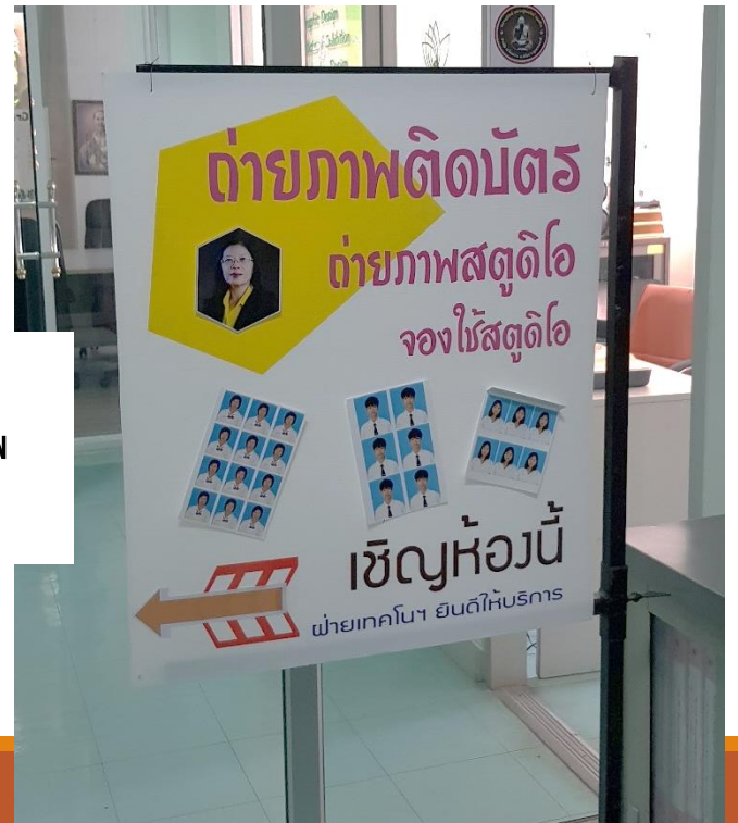
ม.อุบลราชธานี บริการถ่ายภาพ ติดบัตร

ถ่ายภาพติดบัตร ถ่ายภาพสตูดิโอ จองโต๊ะสตูดิโอ