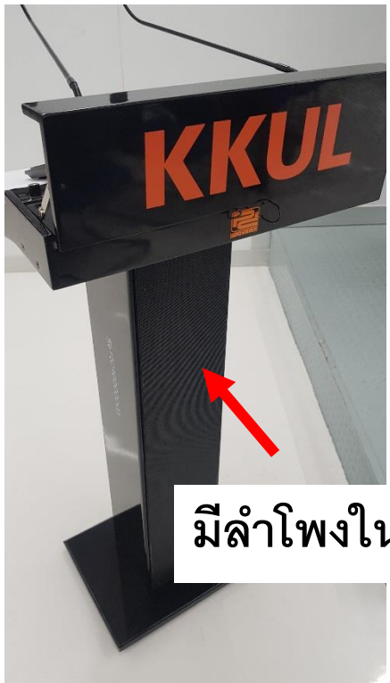
มีลำโพงในตัว