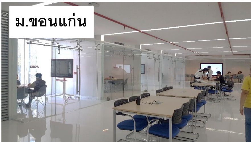
ม.ขอนแก่น